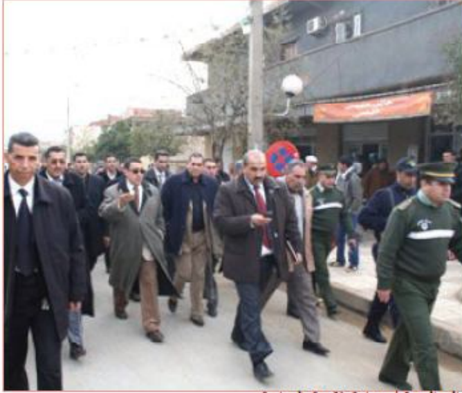
والي المدينة في زيارة تفقدية بالعمارة

ولا تعتبر هذه المشاريع التي تناولناها حالة خاصة، بل هنالك مشاريع أكثر بشاعة وكارثية على غرار دور الحضانة ومحلات الرئيس وكذا الأقطاب الحضرية التي تم بناؤها دون وضع قنوات الصرف الصحي أو الكهرباء.